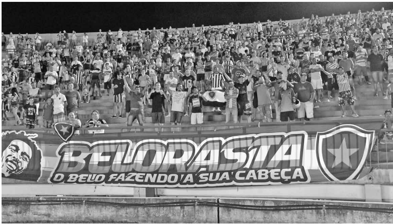
O Botafogo chegou, antes da pandemia, a ter quase cinco mil sócios-torcedores e, hoje, faz campanhas para chegar a dois mil