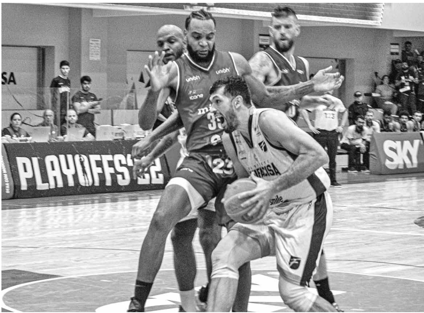
A Unifacisa teve tudo para deixar a série empatada, mas acabou perdendo nos minutos finais e, hoje, tem a chance de se recuperar