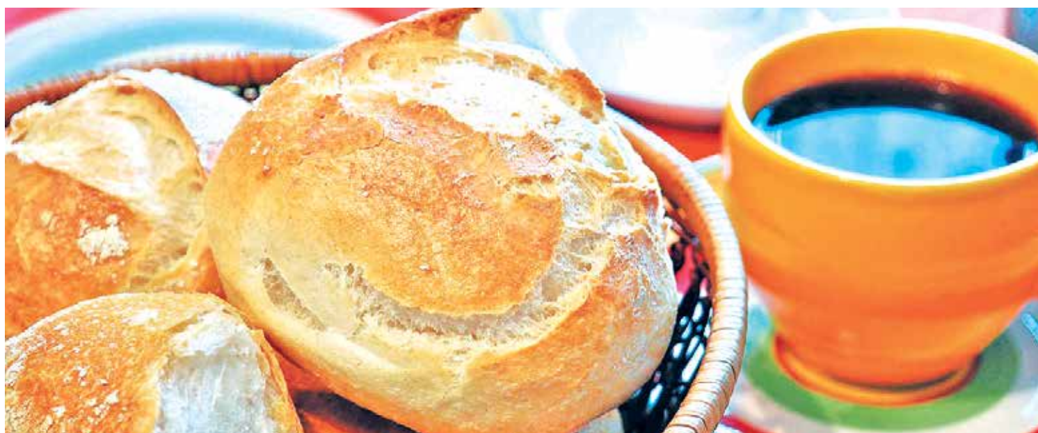
Café foi o produto que teve o maior aumento (78,42%), seguido pelo pão (16%), deixando o café da manhã dos pessoenses mais 'salgado'

No acumulado dos últimos 12 meses, o Índice Nacional de Preços ao Consumidor Amplo (IPCA) é de 11,30%, percentual inferior à inflação da cesta básica. Segundo o economista, as famílias estão empobrecendo e perdendo poder de compra, sobretudo, as de menor poder aquisitivo. Na pesquisa do Dieese, a cesta básica de João Pessoa compromete 51,17% do salário mínimo, que é de R$ 1.212.