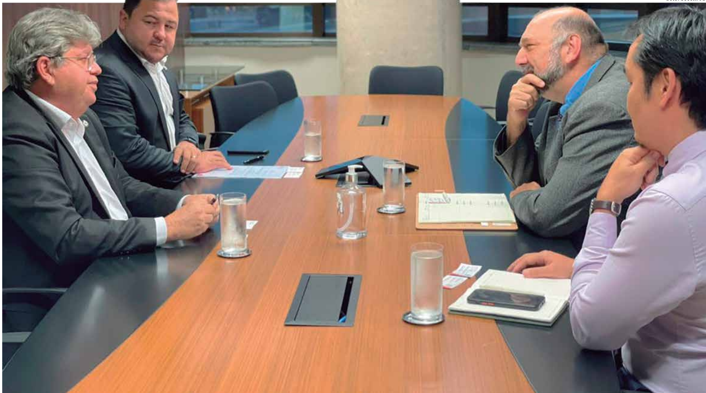
O governador João Azevêdo ressaltou que o equilíbrio financeiro e fiscal do Estado tem sido reconhecido por grandes instituições financeiras, que pretendem injetar recursos em áreas estratégicas