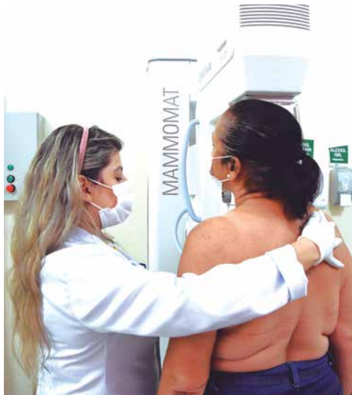
Trinta mulheres por dia farão os exames no Hospital Napoleão Laureano, e uma fila de espera foi feita para o caso de faltosas

“Nós fizemos um edital voltado para pesquisa clínica oncológica e o Napoleão Laureano se classificou para a implantação de um centro de pesquisa. Isso por se tratar de um hospital com tradição que está comemorando este ano 60 anos de existência, com atendimento com mais de 90% voltado para o SUS”, afirma.