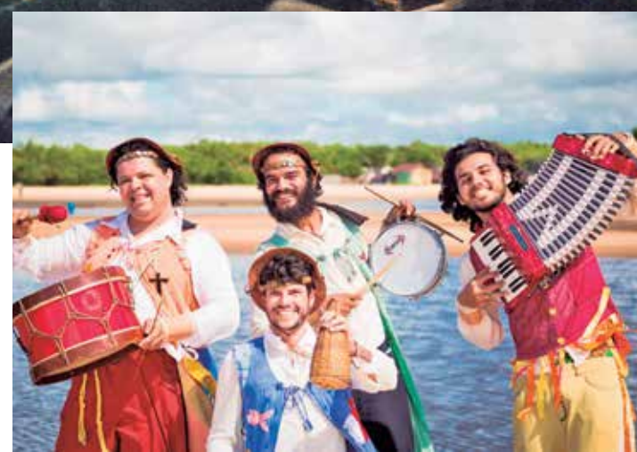
'Guara-Mamo' remonta causos dos mestres do Vale do Gramame

cidades de Pedras de Fogo, Duas Estradas e Solânea. Até 2 de julho, data do encerramento, o projeto também leva espetáculos e oficinas aos municípios de Monte Horebe, Poço Danças, Serra Grande, Esperança, Monteiro, Ouro Velho, São João do Rio do Peixe e Baía da Traição.