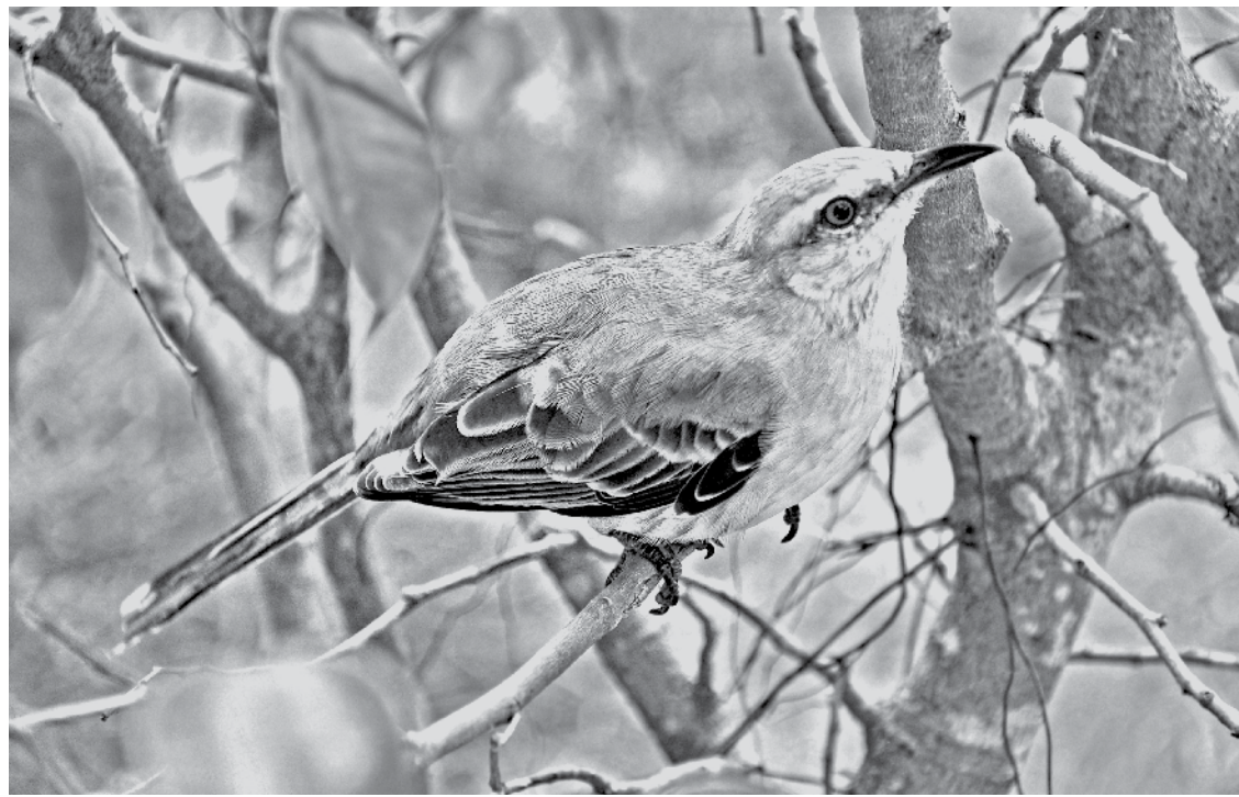
O equilíbrio na natureza