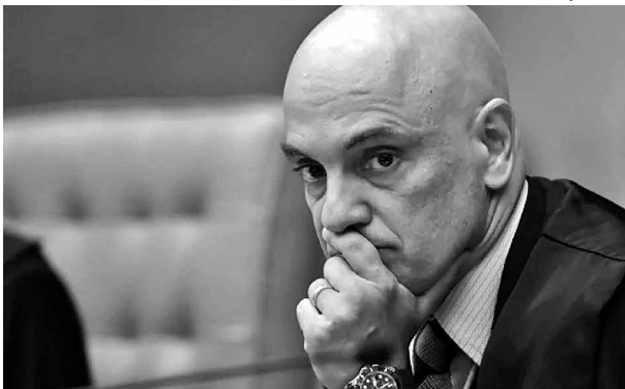
O ministro Alexandre de Moraes deu prazo de 10 dias a Bolsonaro para que forneça explicação sobre o decreto

■ O decreto de Bolsonaro amplia a redução do IPI de 25% para 35%, com o argumento de que é preciso estimular a indústria neste momento de baixo crescimento