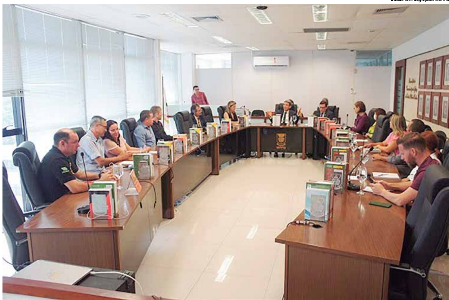
A PGJ realizou reunião com representantes de órgãos públicos que podem atuar na resolução dos problemas na Praça da Paz