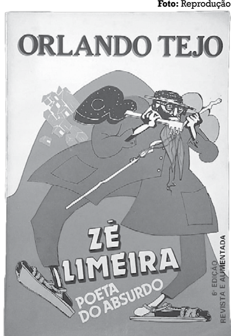
Capa de 'Zé Limeira - O Poeta do Absurdo'