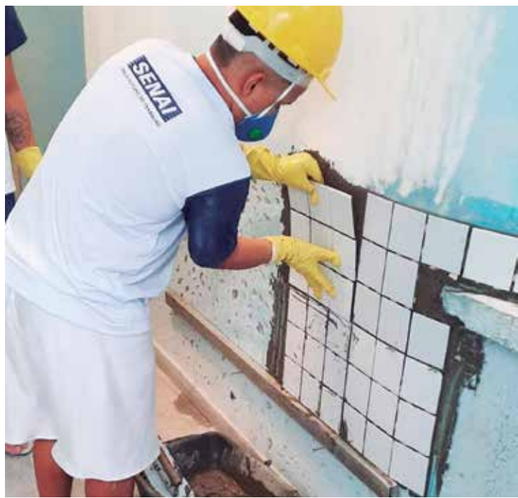
Os reeducandos fizeram cursos de pintor e revestimento cerâmico