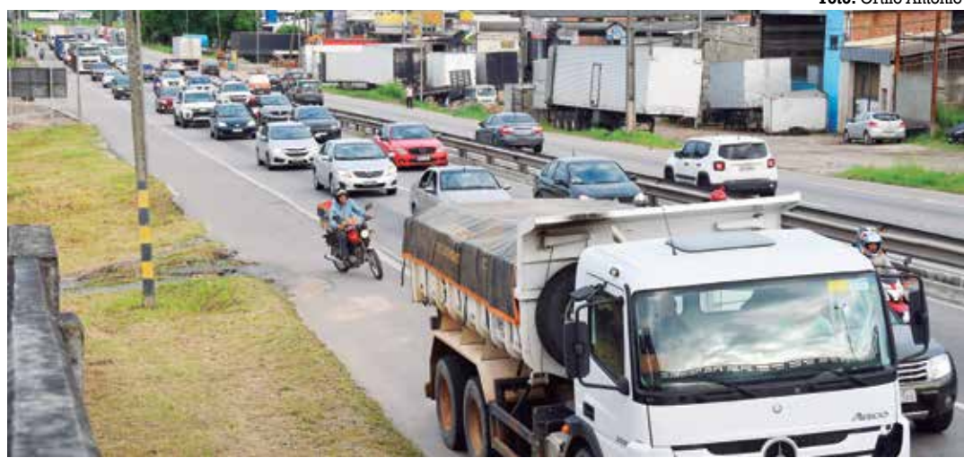
Tráfego ficou lento no sentido Cabedelo - Bayeux e nos bairros que margeiam os trechos congestionados

As desconfianças foram levantadas apesar de os órgãos de investigação nunca terem detectado fraudes no sistema eletrônico de votação. Ao contrário. No ano passado, a Polícia Federal vasculhou inquéritos abertos desde que as urnas eletrônicas passaram a ser usadas, na década de 1990, e não encontrou sinais de vulnerabilidade do equipamento. Os registros de irregularidades ocorreram, na realidade, quando a votação ainda era em cédula de papel. Depois da adoção das urnas eletrônicas, o TSE passou a submeter o equipamento a teste por hackers e não houve constatação de riscos.