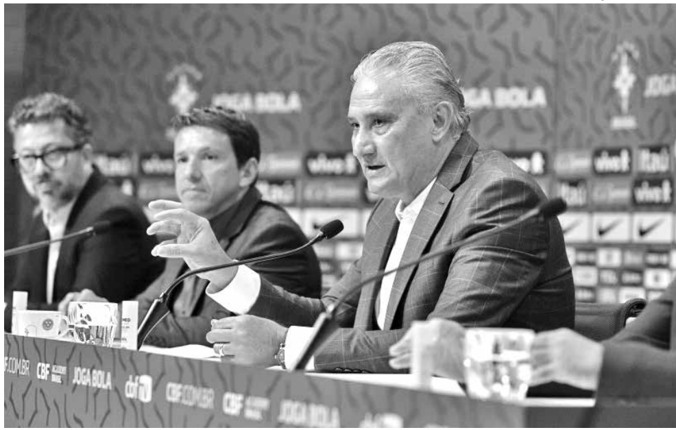
Tite e sua comissão técnica na sede da CBF durante última convocação de jogadores